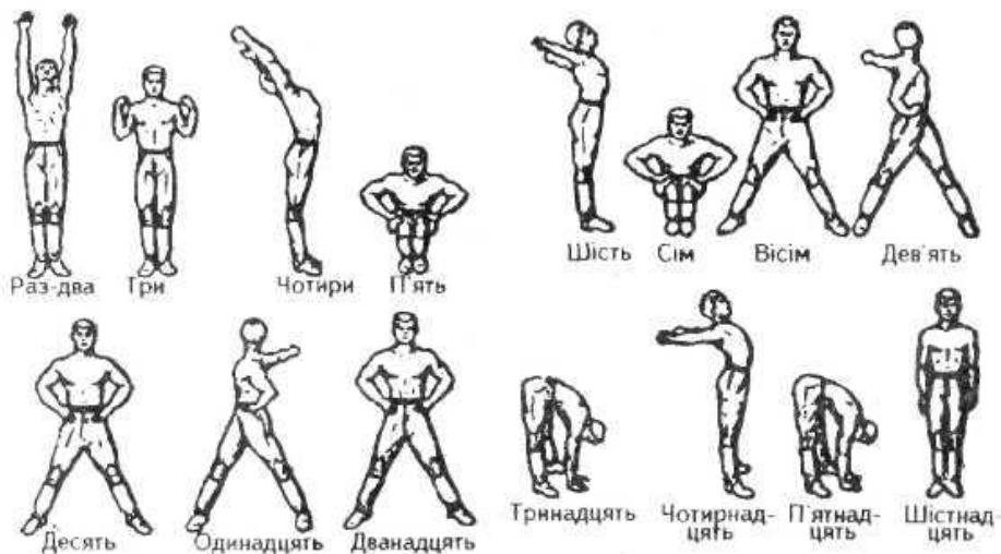
Мал. 1. Перший комплекс вільних